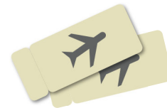
билеты / билеты на самолёт Tickets / Flugtickets